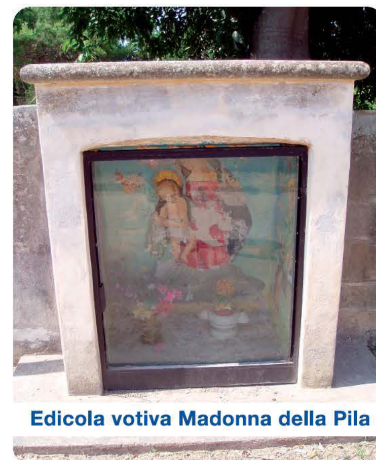
Edicola votiva Madonna della Pila