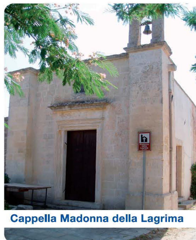
Cappella Madonna della Lagrima